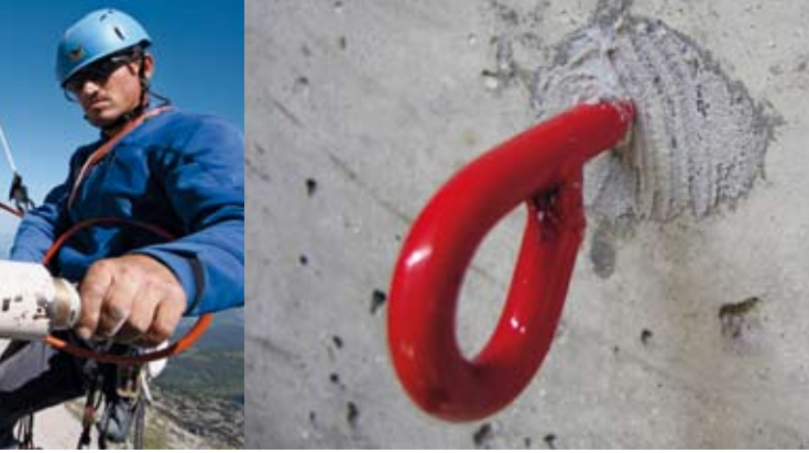
Versuchsreihen der DAV-Sicherheitsforschung: Überprüfung der Auszugsfestigkeit der Sigibolts im Normbeton (Foto rechts) sowie im freien Gelände, in den Routen „Der Schroa“ im Tennengebirge und in der „Maiandacht“ am Hochkönig.

geringe Mörtelfestigkeit jedoch nicht als ursächlich. Alle getesteten Haken hätten einer axialen Belastung mit Körpergewicht und mit großer Wahrscheinlichkeit auch einer Sturzbelastung mit radialer Krafrichtung standgehalten.